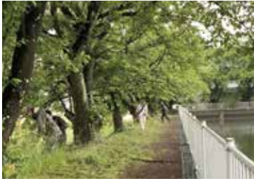
ため池の維持管理