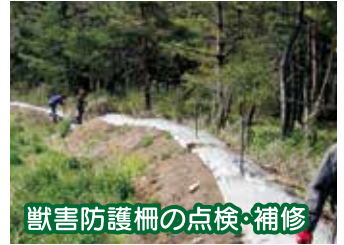
獣害防護柵の点検・補修