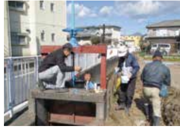
水門の塗装・注油