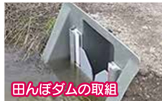
田んぼダムの取組