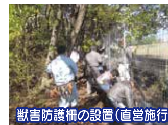
獣害防護柵の設置(直営施行)