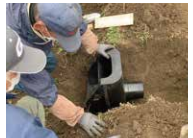
田んぼダムの取組