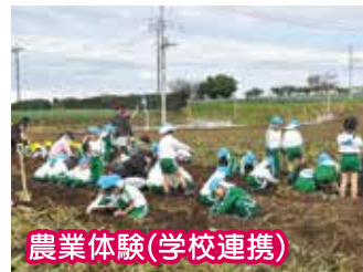
農業体験(学校連携)