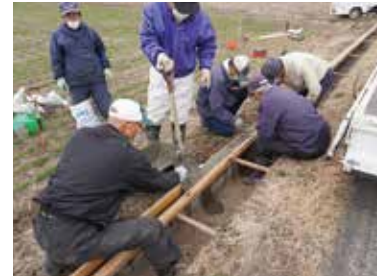
水路側壁の高上げ