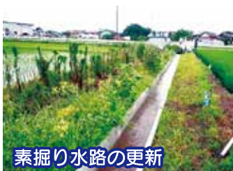
素掘り水路の更新